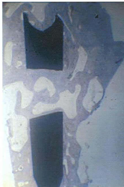
Istologia su lama di Pasqualini dopo 9 anni di funzione (Homo) (Manenti, Pasqualini, Donath)