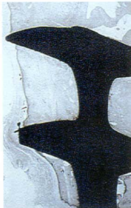
Istologia su vite di Garbaccio dopo 10 anni di funzione (Homo) (Nyborg, Donath)